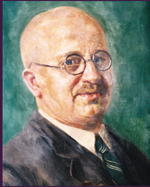
Paul Schulenburg 1871–1937