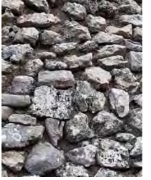
3. Juntado entre mampuestos degradado y algunos mampuestos perdidos.