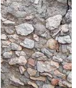
2. Revoco perdido, juntado entre mampuestos existente.