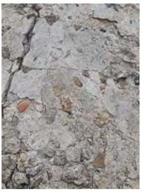
1. Revoco existente pero degradado.