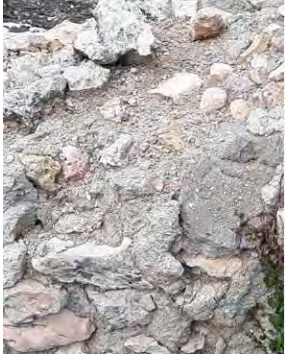
4. Pérdida importante de mampuestos.